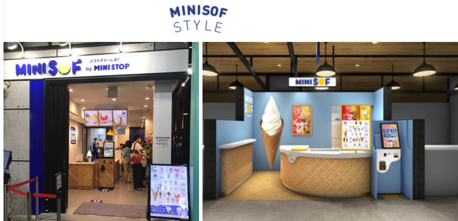
(店舗写真) ※店舗によってデザインは異なります